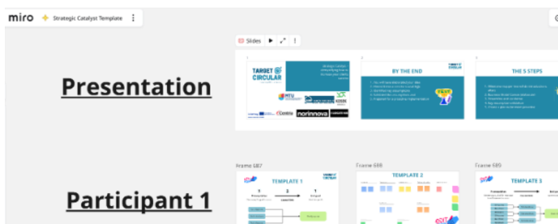
Mynd 1. Sameiginlegt stafrænt vinnusvæði sem ráðgjafar og þátttakendur nýta til að setja fram stefnu á myndrænan hátt, skipuleggja staðfestingarverkefni og móta innleiðingaráætlanir.

Hægt er að fá prent hæft sniðmát sé þess óskað.